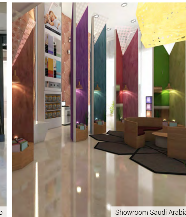
Showroom Saudi Arabia