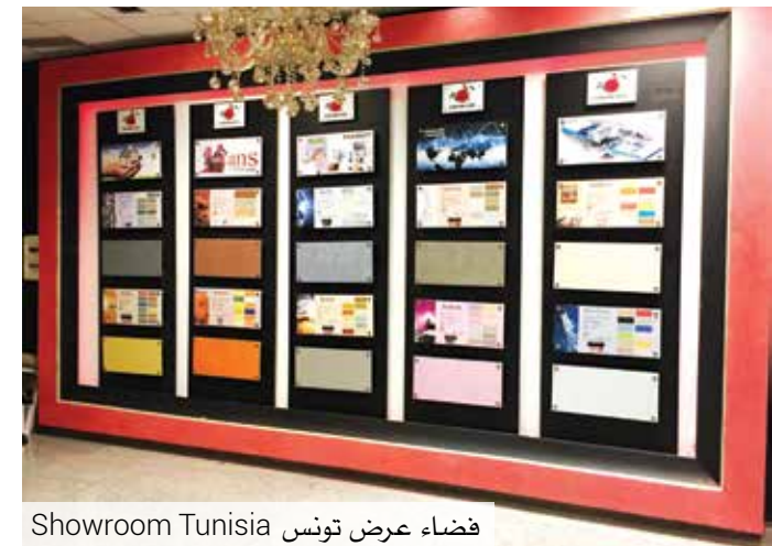
Showroom Tunisia فضاء عرض تونس