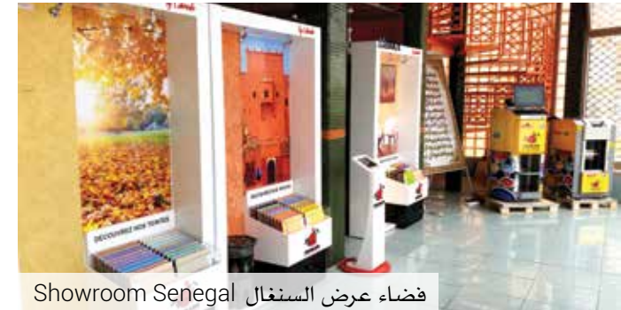
Showroom Senegal فضاء عرض السنغال