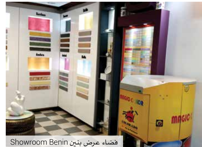
Showroom Benin فضاء عرض بنين