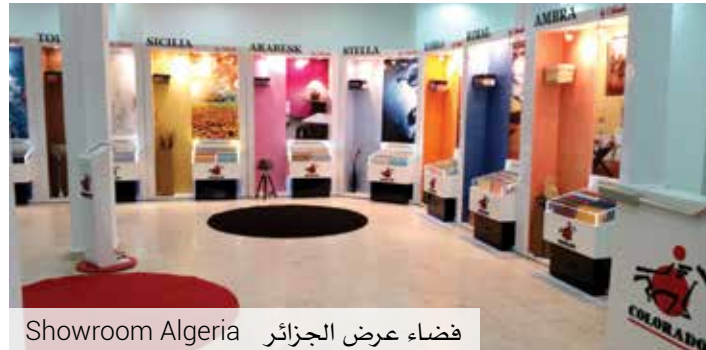
Showroom Algeria فضاء عرض الجزائر