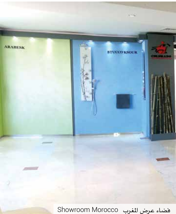
Showroom Morocco فضاء عرض المغرب