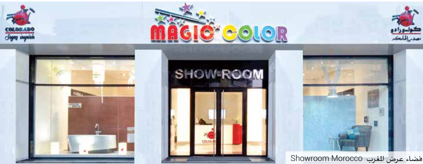
Showroom Morocco فضاء عرض المغرب