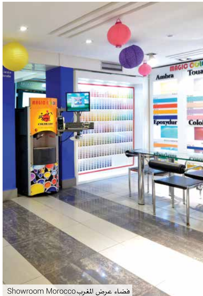
Showroom Morocco فضاء عرض المغرب