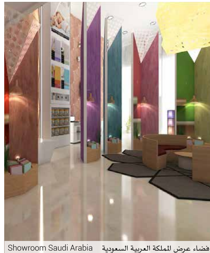
Showroom Saudi Arabia فضاء عرض المملكة العربية السعودية